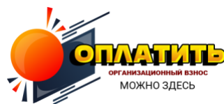
оргвзнос Очное участие 1000 рублей