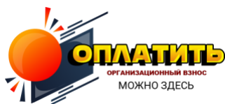
оргвзнос Заочное участие 500 рублей