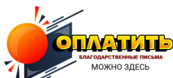
оплата дополнительных благодарственных писем 500 рублей